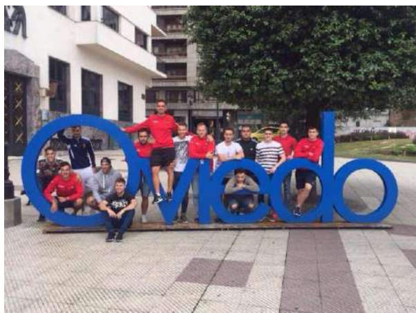
SUBMARINO CF en el NACIONAL DE CLUBES DE OVIEDO 2017

XAPLONTIN , como Campeón de la Liga Laboral F7 entre semana de FutZaragoza.