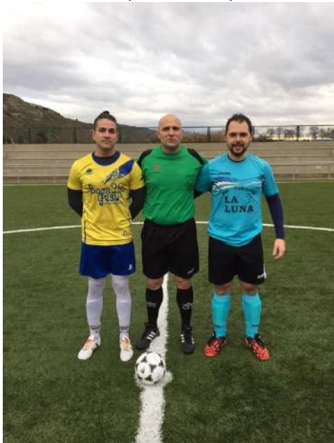
FOTO PARTIDO entre GOZALE F7 vs BAR LA LUNA de 1ª DIVISIÓN F7

La difícil labor arbitral está perfectamente desempeñada en nuestras competiciones, así lo demuestran el alto número de organizadores de campeonatos nacionales, torneos y maratones tanto a nivel local como de otras provincias y autonomías que confían en los más de 80 árbitros y cronometradores que conforman el Comité Técnico Arbitral LDFS. Este comité independiente imparte cursos de capacitación para jugadores LDFS y otras personas interesadas.