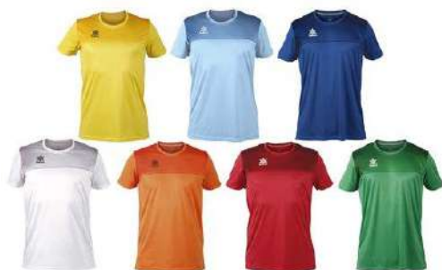
Camisetas LUANVI modelo APOLO FUTZARAGOZA